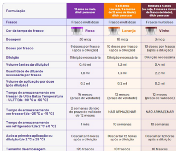
Figura 2 - Apresentação da vacina Comirnaty (covid-19) Pfizer.

Referência: bula do produto < https://www.pfizer.com.br/bulas/comirnaty >